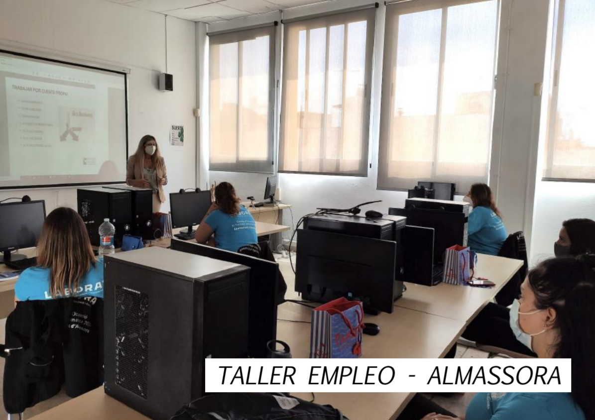
TALLER EMPLEO - ALMASSORA