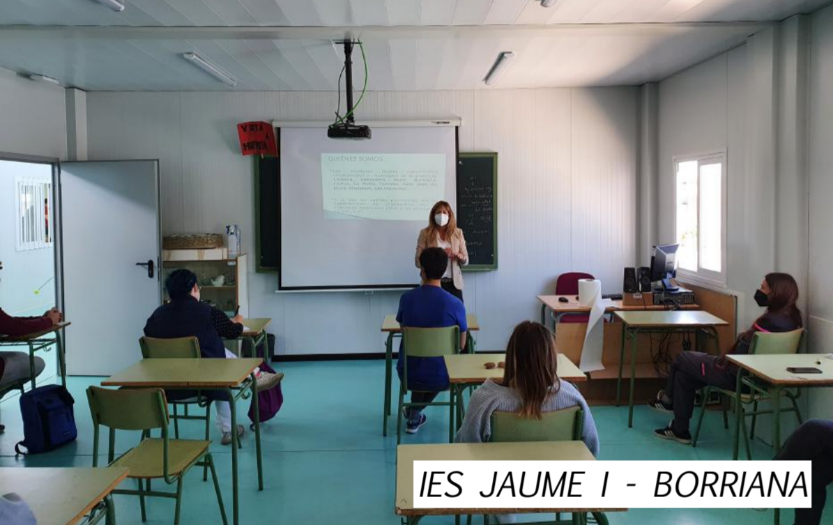
IES JAUME I - BORRIANA