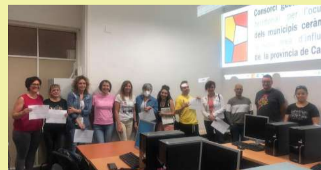
Entrega de diplomas del curso de Power Point en l'Alcora

La misma acogida positiva han tenido estos talleres en Borriana y Almassora, donde se han formado unas 50 personas en los últimos meses.